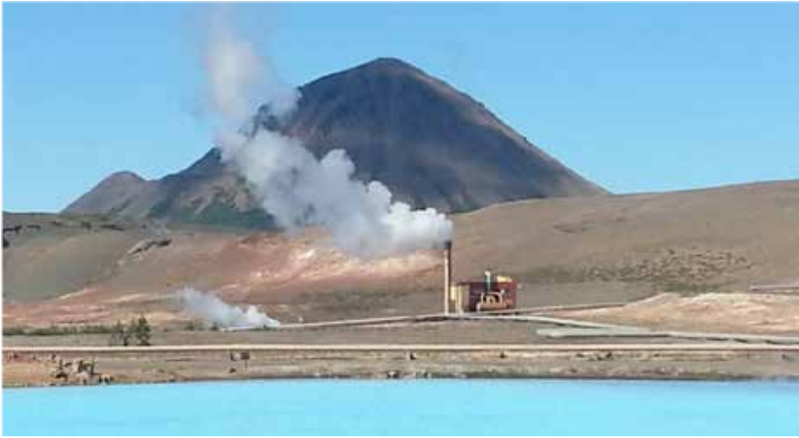
Een kleine centrale.

U komt dan ook voorbij de Krafla centrale, één van de vijf geothermische centrales die hete stoom omzetten in energie. Als u nu weet dat er ook nog circa 13 waterkrachtcentrales zijn, dan weet u dat IJsland energie in overvloed heeft, waarmee het voetpaden kan verwarmen, warm water leveren voor verwarming en bad, zonder dat er cv-ketels of aparte boilers aan te pas komen en ja, ook enorme serres kan verlichten en warm houden waarin winter en zomer groenten en fruit gekweekt worden, tot zelfs ook bananen toe! I'm not kidding you!