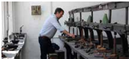
Slijperij Lieckens - Nijlen - foto Ch. Jennis.

Maar ook het aantal Antwerpse diamantbewerkers kende een ongekende terugval. In 1968 waren er in Antwerpen nog 19.010 diamantbewerkers ingeschreven, begin jaren '80 waren er reeds minder dan 10.000 diamantbewerkers aan het werk om nog te verminderen tot 3239 in 1995. In 2008 waren er zelfs nog maar 1146. Heden zijn er 642 diamantarbeiders ingeschreven.