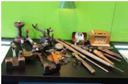
Kempens Diamantcentrum – foto Ch. Jennis.

Begin 1940 verbleven er 23.000 tot 25.000 diamantbewerkers in groot Antwerpen. Hiervan waren er nog maar 10.000 tewerkgesteld. Daarbovenop telde men ongeveer 2000 fabrikanten, 4000 handelaars en 40 makelaars. In totaal schatte men dat 125.000 personen van de diamantsector afhankelijk waren. De diamantbeurzen hadden tezamen ongeveer 3500 leden waarvan 80 à 90% Joden. In schril contrast stond daartegenover, slechts 25 % Joden binnen de arbeiderspopulatie. Gespecialiseerd volgens vakspecialisatie waren 90% van de klievers Joden, 80% snijders, 40% zagers en telde men slechts 20 % Joden bij de slijpers.