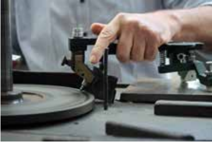
Slijpen van diamant – Slijperij Lieckens - foto Ch. Jennis.

queerd of door oorlogsschade uit hun bewaarplaats geplunderd. Soms bleek de betrouwbare bewaring toch niet zo betrouwbaar.