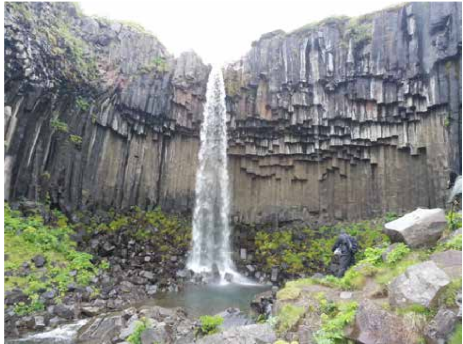
Svartifoss in Vatnajökull NP, niet de waterval is “zwart”, maar het basalt erachter.

IJsland telt 350.710 inwoners en zit daarmee tussen Gent (259.000) en Antwerpen (521.6000). Daarmee is IJsland het dunst bevolkte land van Europa.