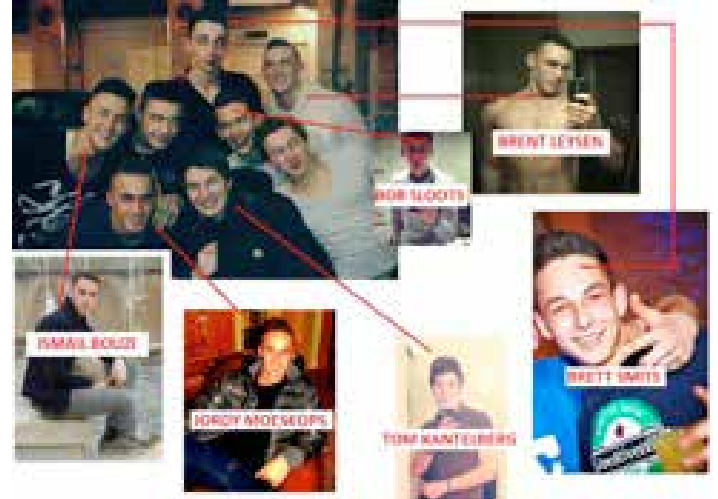
De kopschoppers in Eindhoven werden geïdentificeerd op Facebook.

Toch is het soms moeilijk om sociale media en de privacywetgeving te verenigen. De daders van Eindhoven kregen zelfs een strafvermindering van twee maanden omdat hun