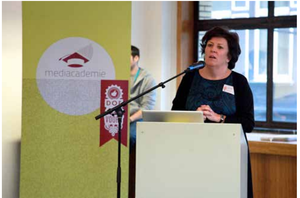
Vlaams mediaminister Ingrid Lieten.

De financiële middelen om deze opdracht uit te voeren werden toever-