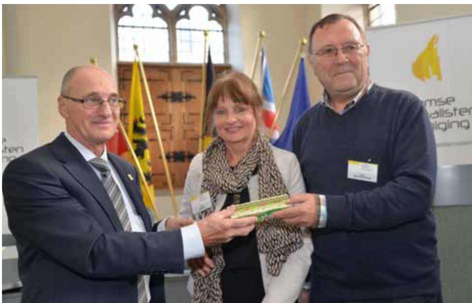
Leden met 25 jaar trouw lidmaatschap ontvangen uit de handen van de voorzitter een geschenk.

Afgesproken werd om in de nabije toekomst toch nog soortgelijke initiatieven te nemen. Prioriteit zal dan gegeven worden aan de laatstejaarsstudenten van de scholen met opleiding journalistiek (o.m. via stagiair-lidmaatschap) en naar journalistieke correspondenten (bv. voor kranten). De leden worden verzocht om ook de coördinaten (e-mailadressen) van collega's die nog geen lid zijn door te geven.