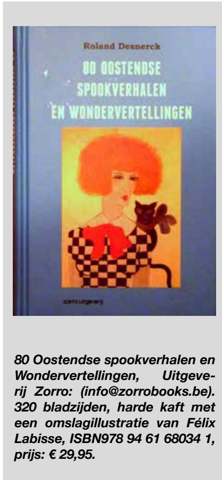
80 Oostendse spookverhalen en Wondervertellingen, Uitgeverij Zorro: (info@zorroboks.be). 320 bladzijden, harde kaft met een omslagillustratie van Félix Labisse, ISBN978 94 61 68034 1, prijs: € 29,95.