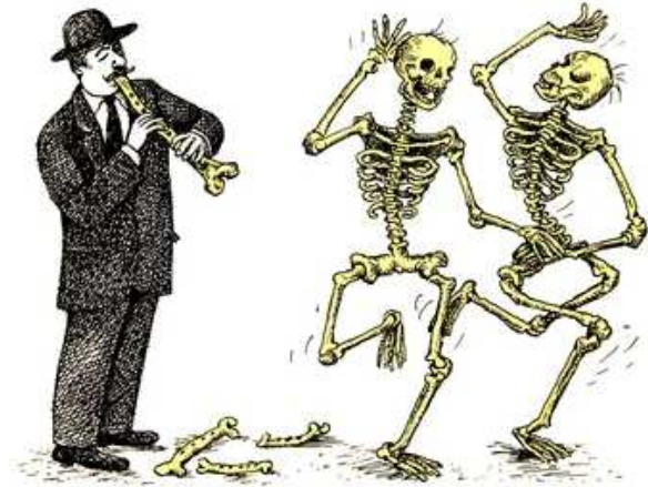
Jiri Sliva, "danse macabre", zeefdruk, 32 x 24 cm, 2 kleuren

haat aan te zetten, is ook niet goed te praten.