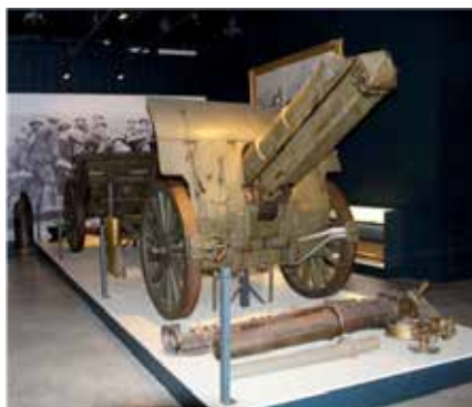
Museum Passchendaele 1917, foto Ch. Jennis.

De veldslag duurde 100 dagen, gemiddeld werden er dagelijks 5000 personen gedood.