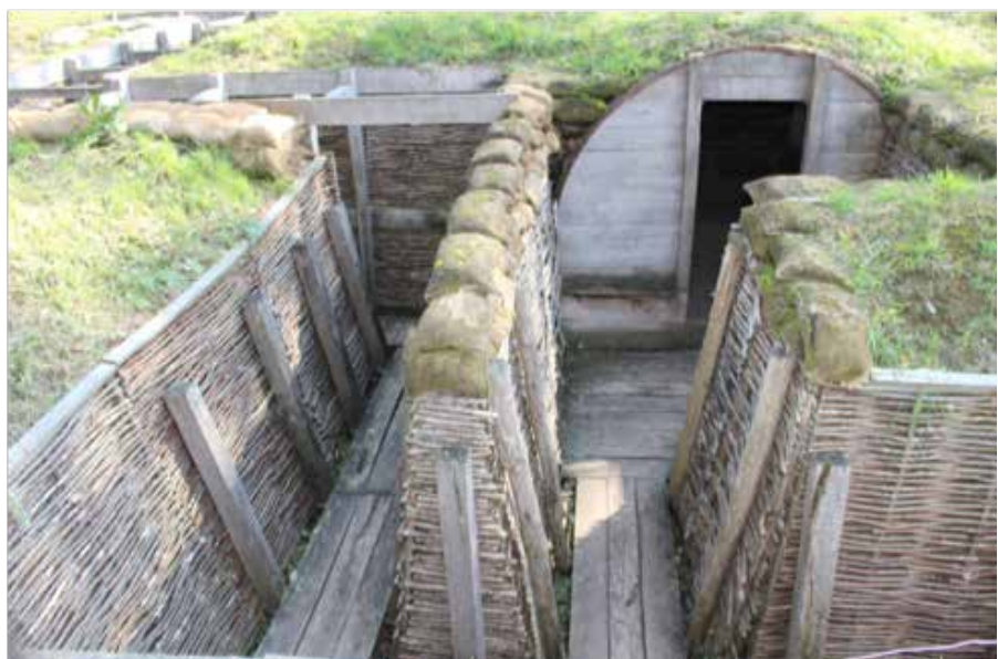
Tranchées, Museum Paschendaele, foto Ch. Jennis.

In 1916 pogen de Duitsers het vastgelopen front te doorbreken via Verdun. De veldslag zou 300 dagen duren. 300.000 mensen werden afgeslacht, 1000 personen per dag. 492.000 mannen werden gewond waarvan vele blijvend invalide. De Duitsers veroverden forten, maar deze werden heroverd door Fransen. Het gevecht begon op 21 februari 1916 en eindigde op 15 december 1916 waarbij de