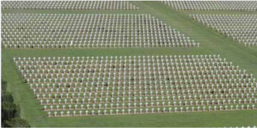
Franse militaire begraafplaats Verdun – foto Ch. Jennis.

frontlijn de zelfde positie kende als voor februari 1946.