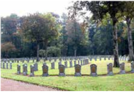
Belgische militaire begraafplaats Houthulst.

Ten zuiden van het dorpscentrum van Houthulst, ligt de Belgische militaire begraafplaats van de soldaten die tijdens het eindoffensief van 28 september 1918 sneuvelde. In totaal liggen er 1907 graven waarvan 81 van Italiaanse gesneuvelde soldaten die door Duitsers werden gevangengenomen om als levend schild te worden opgesteld.