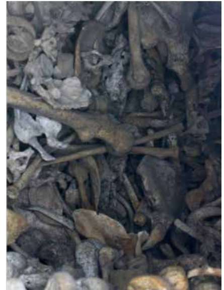
Het Ossuarium van Douaumont, Verdun.

Het Ossuarium van Douaumont, Verdun, bevat de stoffelijke resten van ongeveer 130.000 onbekende Franse en Duitse soldaten. Aan de buitenzijde van het gebouw kan men door kleine raampjes de beenderen en schedels zien liggen.