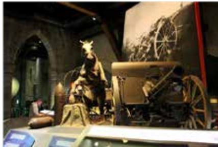
Sfeerbeeld - Flanders Fields Museum leper, foto Ch. Jennis.

foto's, filmbeelden en kaartmateriaal. Je daalt 6 meter af in een diepe Britse dugout, compleet heringericht met communicatie en verbandpost, pompkamer, hoofdkwartieren en slaapplekken. Men ervaart hoe de Britten als mollen onder de grond leefden. Eveneens een blikvanger is een netwerk van Duitse en Britse loopgraven in open lucht.