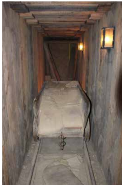
'Deep dugouts' Memorial Museum Paschendaele 1917, foto Ch. Jennis.

Het leven aan het front was monsterlijk hard en gemeen. In de voorste linies van het front waren de kansen om gewond of gedood te worden bijzonder hoog. Maar het was vooral het onmenselijke, het zowel fysisch als psychisch uitputtend verblijf in de onder water staande loopgraven en de doordringende geur van rottende krengen van paarden en lijken die de soldaten vaak tot wanhoop dreven. 'Langs heel dit gebied raakt er hoe langer hoe meer los uit de zware kleigrond. Lijken en voorwerpen worden